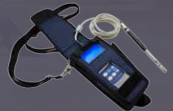
Hands-free Case now available!